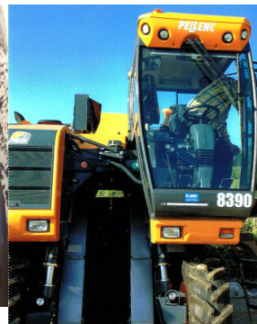
Unsere neue Maschine